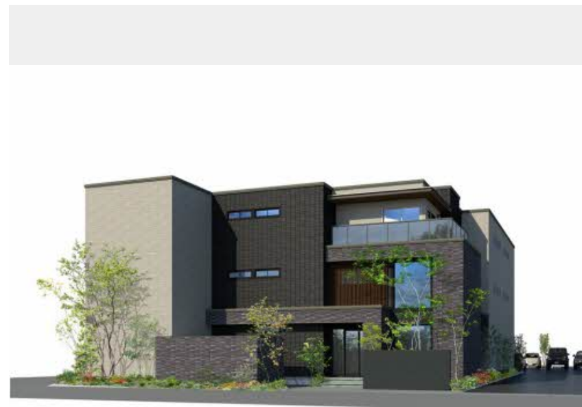
※写真はイメージです パースは実際の図面をもとに描き起こしたイメージで、実際のものとは異なる場合があります