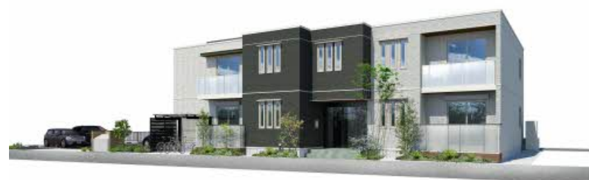
※写真はイメージです パースは実際の図面をもとに描き起こしたイメージで、実際のものとは異なる場合があります