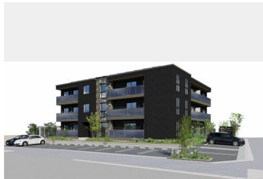
※写真はイメージです パースは実際の図面をもとに描き起こしたイメージで、実際のものとは異なる場合があります。