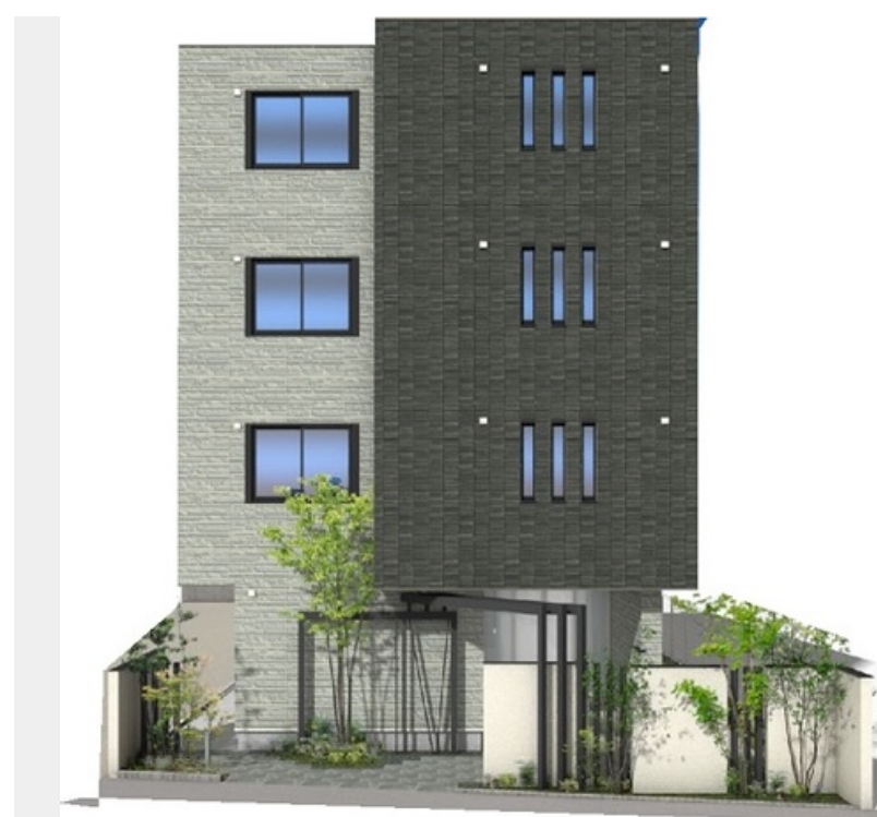
こちらはイメージになります。実物とは色合いや質感が異なる場合がございます。ご了承ください。