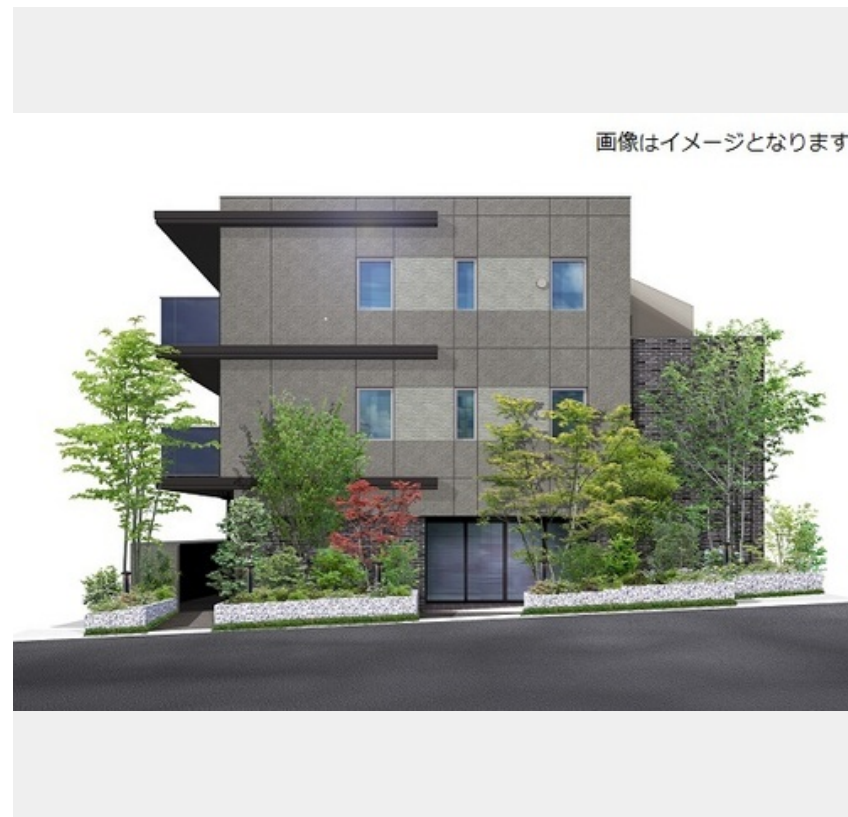
画像はイメージとなります