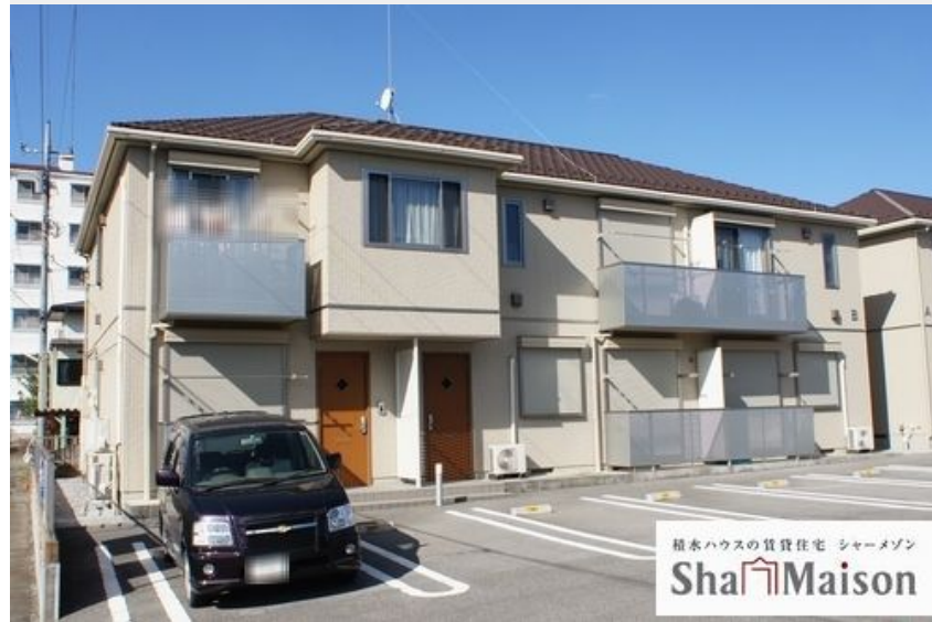
積水ハウスの賃貸住宅 シャーメゾン Sha Maison