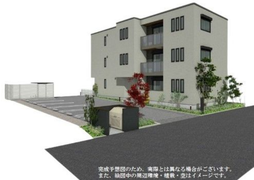
完成予想図のため、実際とは異なる場合がございます。また、絵图中的の周辺環境・植栽・空はイメージです。