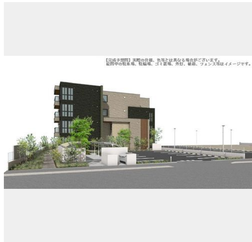
【完成予想図】実際の仕様、色等とは異なる場合がございます。近隣の駐車場、駐輪場、ゴミ置場、外灯、植栽、フェンス等はイメージです。