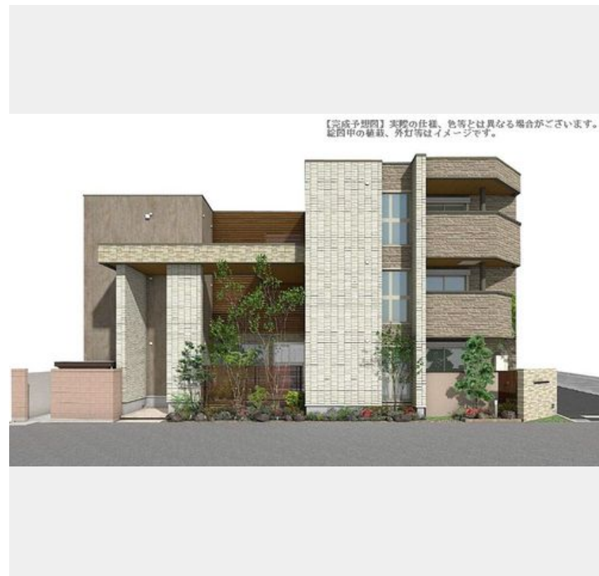
【完成予想図】実際の仕様、色等とは異なる場合がございます。図面中の植栽、外灯等はイメージです。