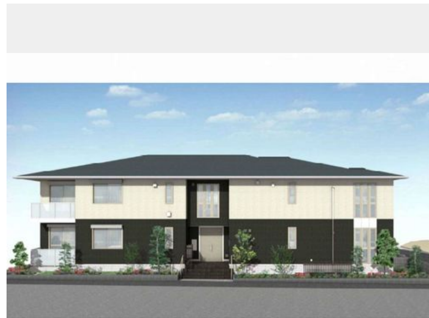
完成予想図。実際の建物と異なる場合がございます。