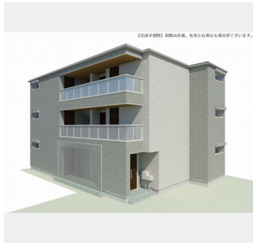
【完成予想図】実際の仕様、色等とは異なる場合がございます。