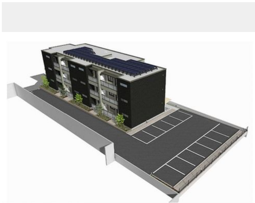
※この画像はイメージとなります。植栽等、実際とは異なる場合があります。