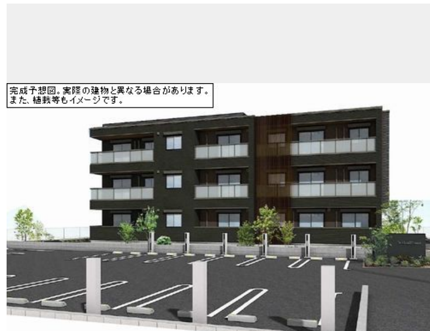
完成予想図。実際の建物と異なる場合があります。また、植栽等もイメージです。