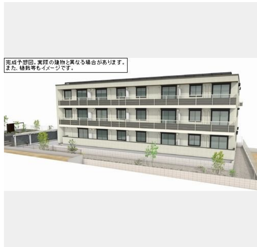
完成予想図。実際の建物と異なる場合があります。また、植栽等もイメージです。