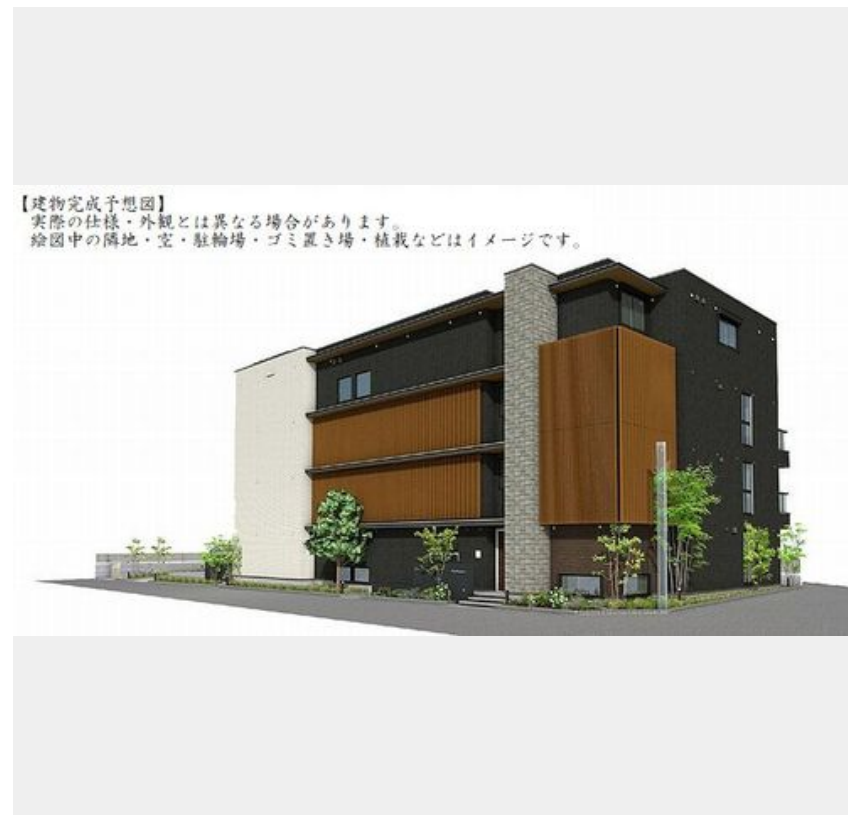
【建物完成予想図】 実際の仕様・外観とは異なる場合があります。 絵图中的の隣地・空・駐輪場・ゴミ置き場・植栽などはイメージです。