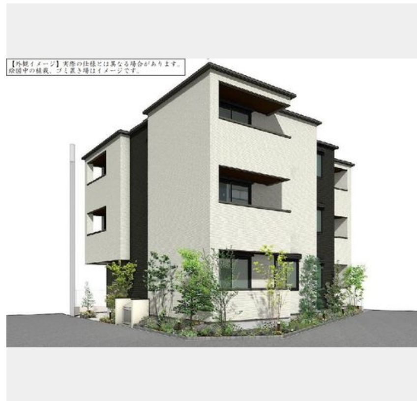
【外観イメージ】実際の仕様とは異なる場合があります。除却中の植栽、ゴミ置き場はイメージです。