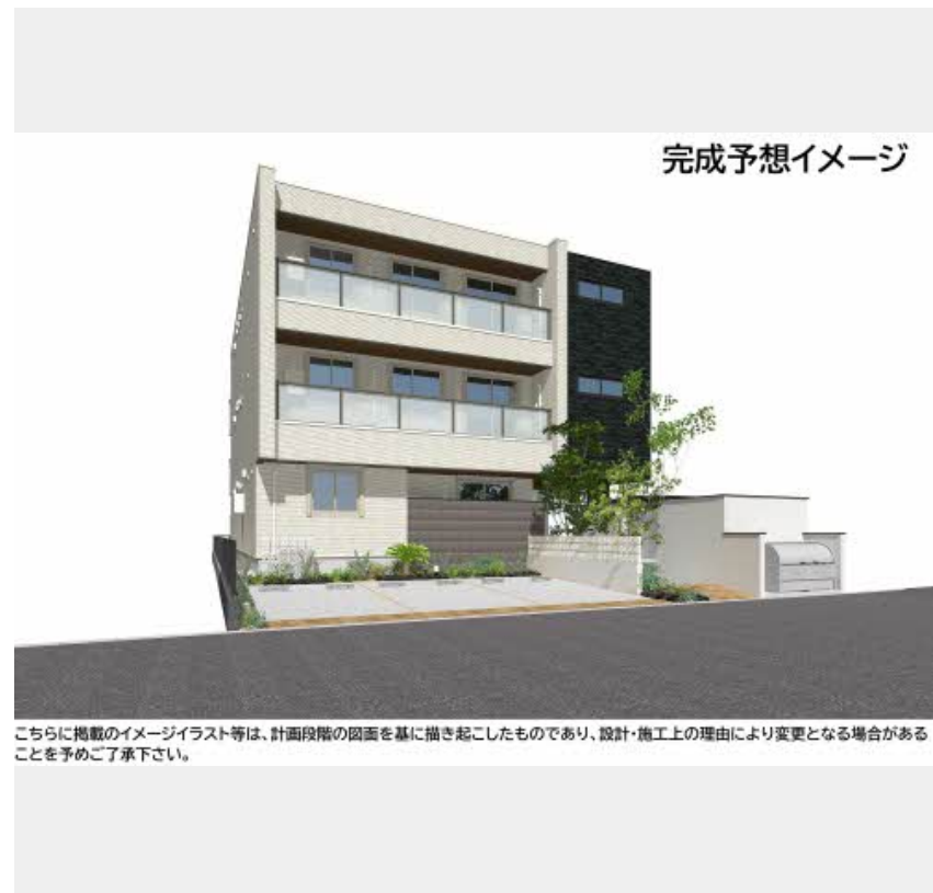
完成予想イメージ

こちらに掲載のイメージイラスト等は、計画段階の図面を基に描き起こしたものであり、設計・施工上の理由により変更となる場合があることを予めご了承下さい。