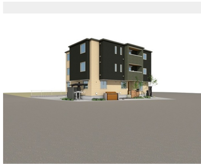
外観イメージです。実際の完成現場とは配色、仕様等変更になる場合がございます。