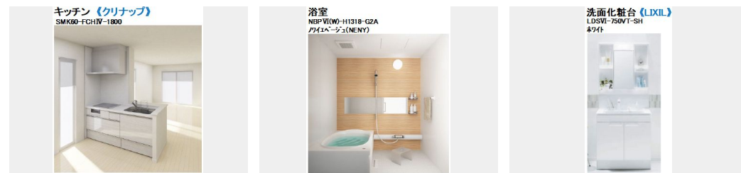
キッチン (クリナップ) SMK90-FCHV-1800