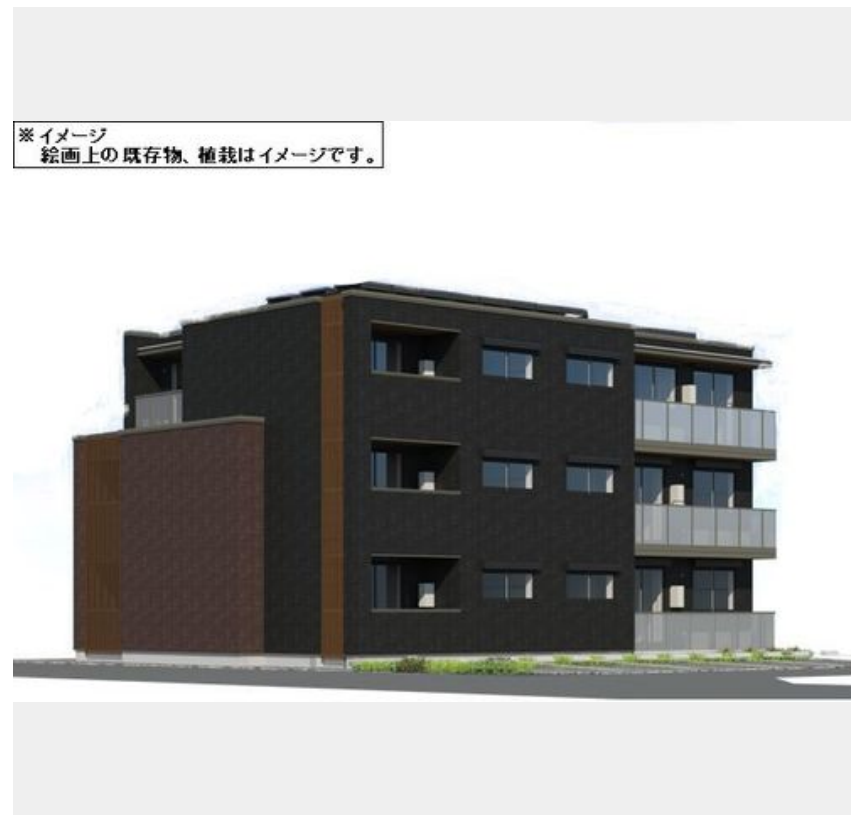
※イメージ 絵画上の既存物、植栽はイメージです。