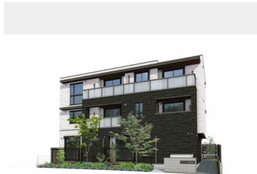
・パースはイメージです。・実際と異なる場合がございます。

保証人不要プラン要加入 / シャーメゾンライフSUPPORT24 (月額880円税込) にご加入いただきます。 / ご入居にかかる諸費用として、ハウスクリーニング費 73,700円 (税込) が必要です。 / 火災保険へのご加入が条件となります。 ※ご入居中は、借家人賠償責任保険・個人賠償責任保険が付帯された火災保険へのご加入が必要となります。 積水ハウス不動産グループでは、万一の事故の際、グループが連携して迅速に対応できる「シャーメゾンライフGUARD」(*) へのご加入を推奨しております。 *保険契約の取扱代理店は、積水ハウス不動産中部(株)および積水ハウス不動産パートナーズ(株)となります。 / 積水ハウス不動産パートナーズの保証人不要プラン『らくらくパートナー』に加入が必要です。 [新規契約時] 事務手数料: 33,000円 (税込)、 [毎月] 保証料: 月額賃料等の2% / 諸費用及び、契約に要する費用は別途打合せ / ■ペット相談可 (室内小型犬と猫合計2匹まで) / 更新料: 52,000円